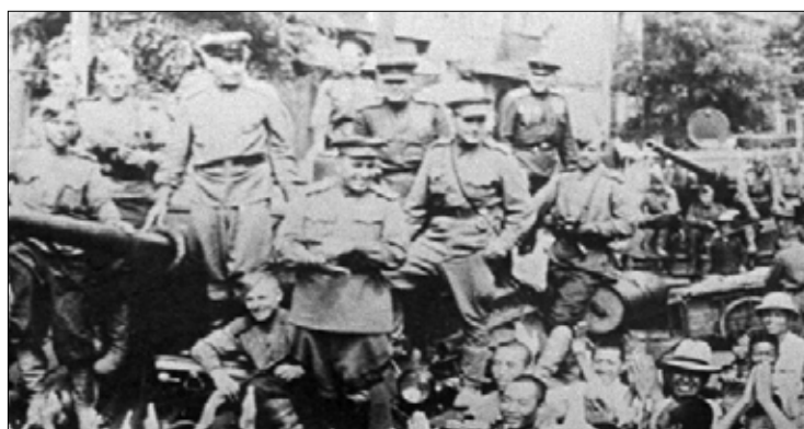
Конец Второй мировой войны

Всего от начала и до конца Второй мировой войны в нее оказались втянуты более 60 государств. Так или иначе от боевых действий пострадали 1,7 млрд человек. Бои велись на территории 40 стран, а также в морских и океанских водах. Количество жертв в войне составило, по разным оценкам, от 55 млн до 70 млн человек, из них, также по оценкам разных исследователей, от 27 млн до 41 млн потерял СССР. Большинство жертв мирового конфликта стали мирные жители.