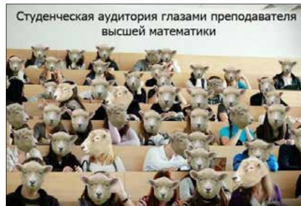
Студенческая аудитория глазами преподавателя высшей математики