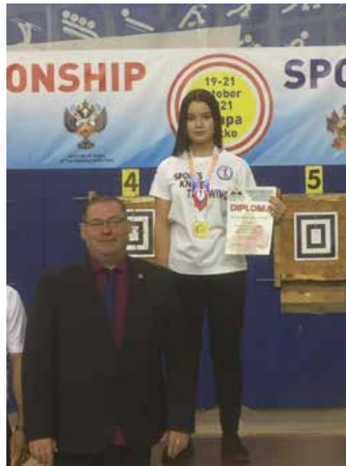
На высшей ступени пьедестала, Чемпионат мира, 2021 год.

Еще она пробовала рисовать, и, как многие из нас в школьные годы, никак не могла определиться со спортивными предпочтениями - занималась яхтингом, сер-