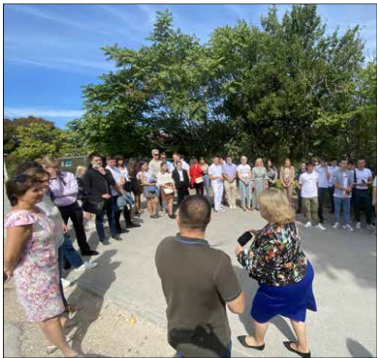
Окончание. Начало на с.1

10 сентября, накануне начала учебного процесса, студенты-первокурсники всех направлений подготовки, за исключением психологов, впервые собрались вместе в одной аудитории.