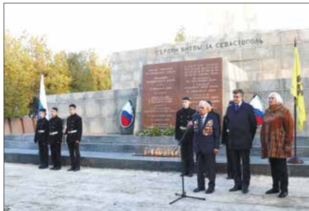
Окончание. Начало на с.1

В Севастополе, в военно-историческом музее-заповеднике прошла церемония переноса Вечного огня. Его на время переместили с традиционного места у Обелиска Славы в здание музея диорамы «Штурм Сапун-горы 7 мая 1944 года».