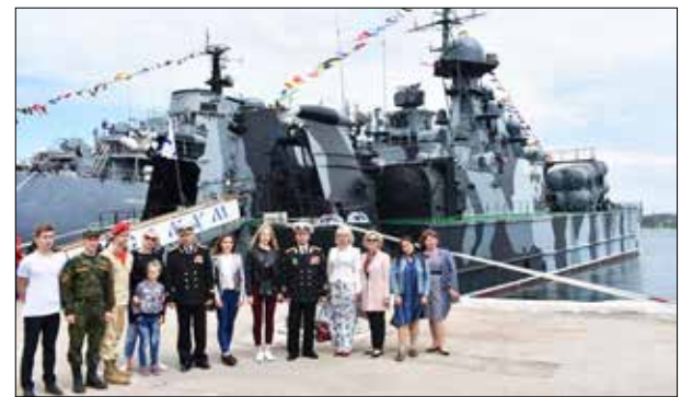
Посещение Соединения десантных кораблей Крымской военно-морской базы, 2018 г.