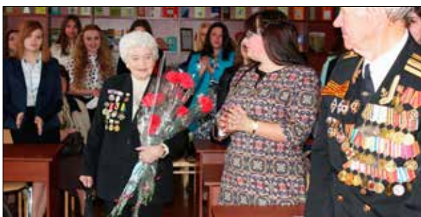
«Знаю, помню, горжусь». Встреча студентов института с ветеранами Великой Отечественной войны.