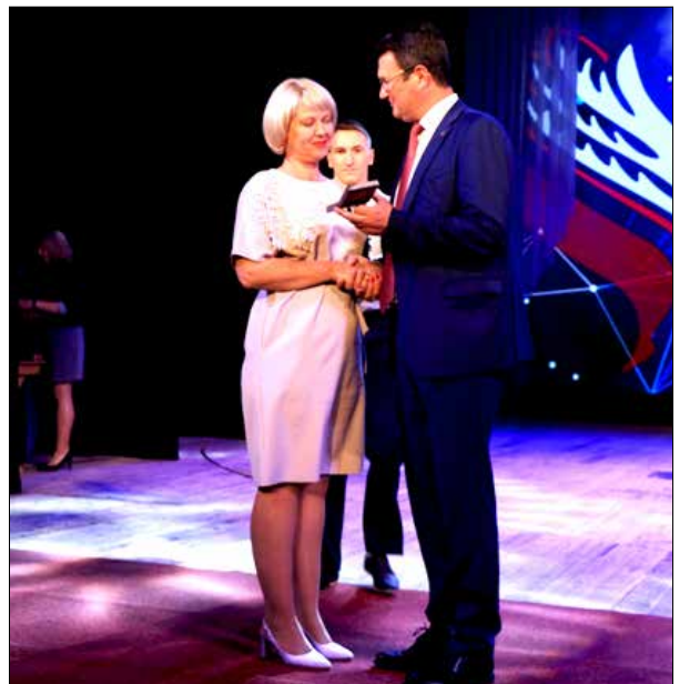
Награждение коллектива Севастопольского экономико-гуманитарного института Золотой медалью имени В.И.Вернадского, октябрь, 2018 г.