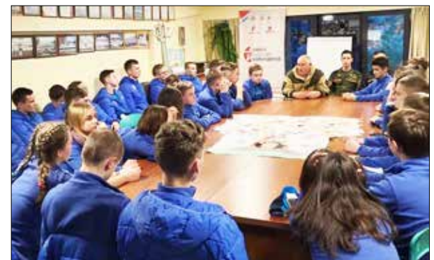
Занятия в «Школе будущих командиров», 2018 г.