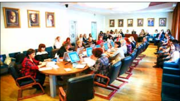
Международная научно-практическая конференция, 2015 г.