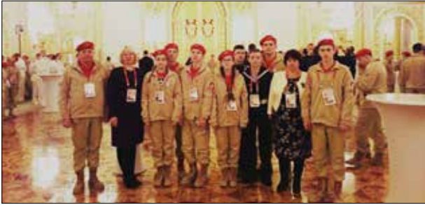
На торжественной церемонии, посвященной Дню Защитника Отечества. Москва, Георгиевский зал Кремля, февраль 2018 г.