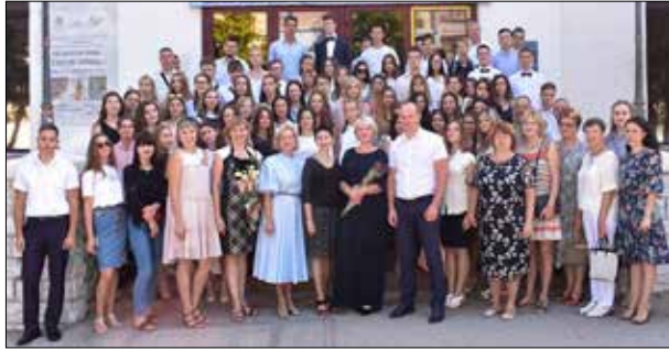
Начало нового учебного года, 2018 г.