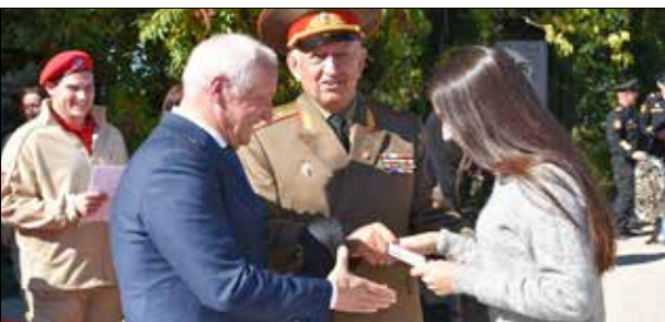
Торжественное вступление студентов юнармейского отряда института в ряды ДОСААФ России, сентябрь 2018 г.