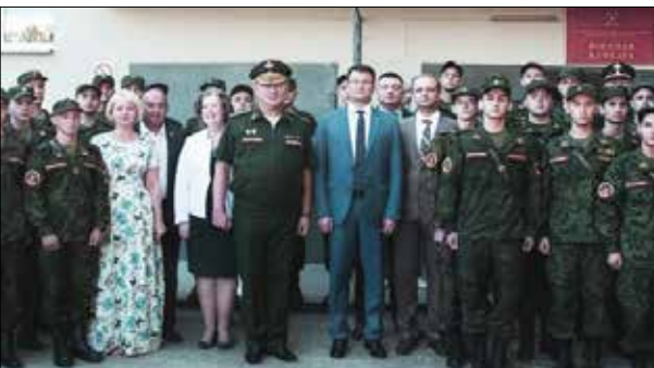
Открытие военной кафедры КФУ, 2017 г.