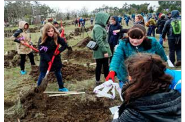
«Сирень Победы», май 2015 г.