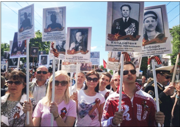
На шествии Бессмертного полка, 2016 г.