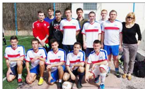
Сборная команда института по футболу, 2015 г.