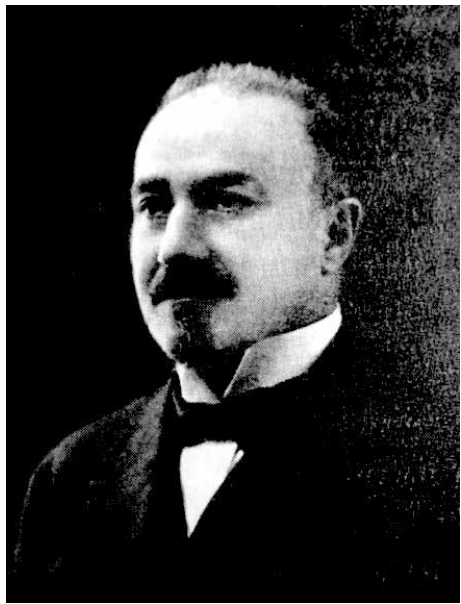
С. С. Крым

В 1925 г. на базе педагогического факультета Крымского университета был создан Крымский государственный педагогический институт, который и просуществовал под таким названием с 1925 по 1972 гг.