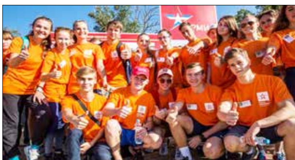
Студенты-волонтеры Института на открытии кластера парка культуры и отдыха «Патриот», 2017 г.