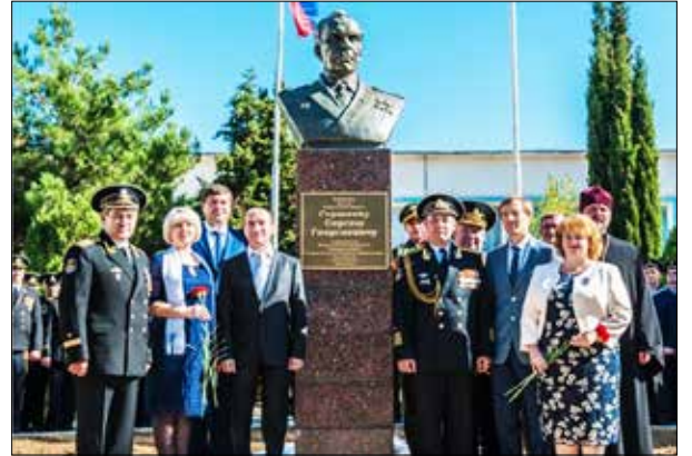
Торжественное открытие бюста Адмиралу Флота Советского Союза С.Г.Горикову, 2017 г.