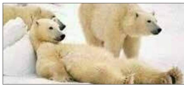
Неделя до экзамена