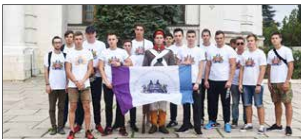
Военно-исторический фестиваль «Русская Троя», 2018 г.