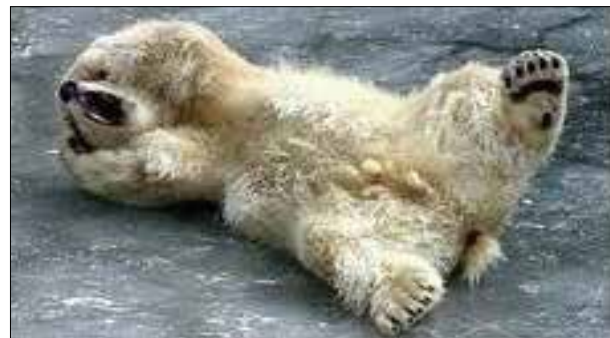
Два дня до экзамена