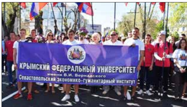
Первомай 2017 года.