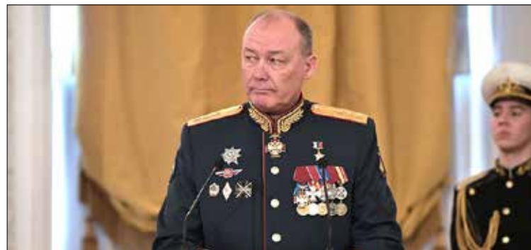
Генерал-полковник Александр Дворников