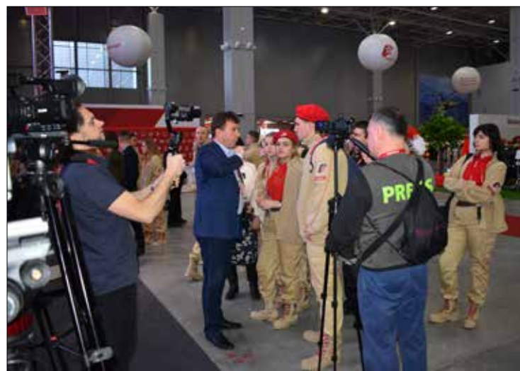
Севастопольские юнармейцы знакомятся с работой интерактивной медийной площадки

В наших планах очень много патриотических мероприятий: это — и военно-спортивные