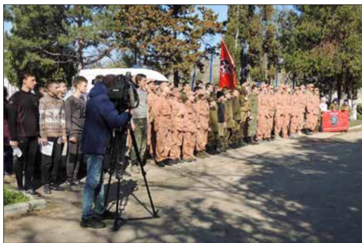
Занятия в школе будущих командиров

«Юнармия» живет активной жизнью, поэтому есть необходимость обмениваться опытом и лучшими практиками юнармейского движения с целью сплочения молодых людей чувством любви к Родине, социальной ответственностью перед обществом, умением жить интересами коллектива. Именно этим целям служит